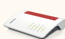
FRITZ!Box 5690 4 € / Monat

Wir setzen ausschließlich auf die mehrfachen Testsieger von FRITZ!