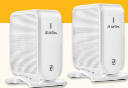
Wifi 2.0 - MESH ab 10 € / Paar / Monat

Unsere Lösung: FRITZ!Box + 2 AirTies Air 4960 = grenzenloses Wifi