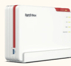
FRITZ!Box 5690 Pro 10 € / Monat